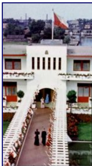
Pergola Villa Jongerius