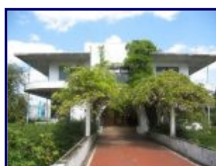
De villa anno 2006