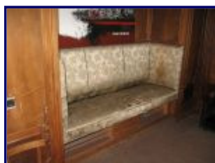
Zitbank in de woonkamer, huidige situatie