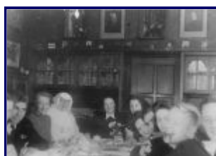
Familietafeel in de huiskamer