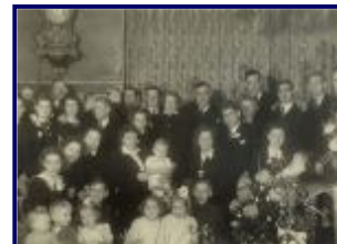
Familie Jongerius voor de klok