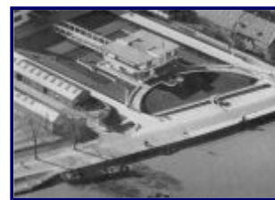
Villa Jongerius in 1939