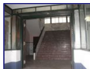
Marmere trap in het kantoor, huidige situatie