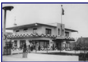
Villa Jongerius in 1939

Bekijk een paar foto's van de villa en het kantoor van Jongerius