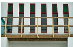
- de ramen van de kapel met groene bovenlichten-

U kunt zich aanmelden voor deze Nieuwsbrief op de website van de Stichting Vrienden van het Jongeriuscomplex Kom ook eens kijken >>>>