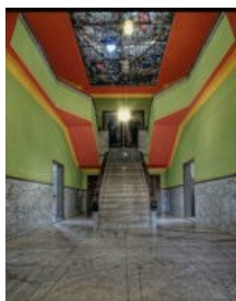
De hal van de villa in de oorspronkelijke kleuren (bewerking FBW-architecten)