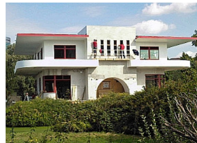
.....De Villa oktober 2011