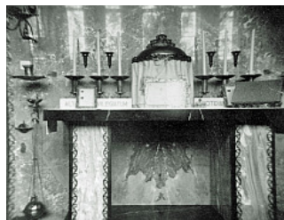
- altaar huiskapel 1939 -

Op 2 en 3 mei heeft een groepje studenten van NIMETO onder leiding van een restauratieschilder de wandschilderingen verder blootgelegd.