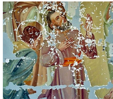
- hervonden wandschildering -

Sinds april 2011 is het hele complex, dus zowel de villa als de tuin en het kantoor, een rijksmonument.