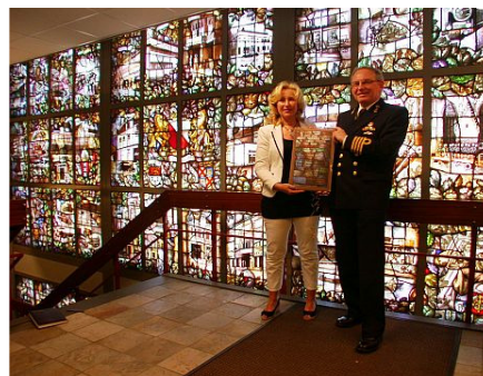
- Overdracht glas in loodraam -

Na een zorgvuldige aanbestedingsprocedure is de restauratie van de villa gegund aan BK Bouw uit Bussum. De aannemingsovereenkomst is op 10 mei jl. getekend, de voorbereidingen voor de bouw zijn in volle gang en vanaf 28 juni is Villa Jongerius een bouwplaats. Als alles volgens plan verloopt, staat er in het najaar van 2011 een stralende witte villa aan het Merwedekanaal waar u van harte welkom bent voor een drankje, een hapje en een bezoek aan een expositie.